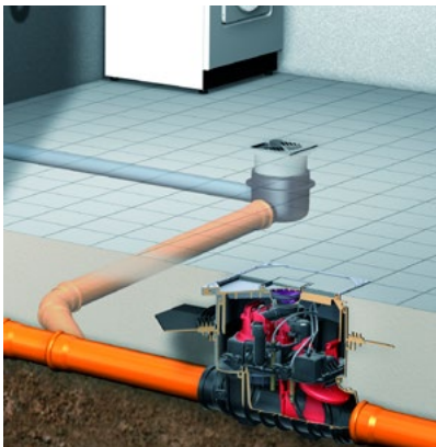
Przykład zabudowy zaworu Pumpfix F Komfort