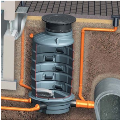
Przydomowa studzienka przeciwzalewowa z polietylenu wyposażona w zawór zwrotny z pompą Pumpfix F