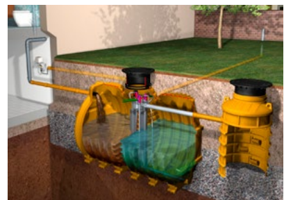
Przydomowa oczyszczalnia ścieków INNO-CLEAN

– stosuje się wszędzie tam, gdzie nie ma możliwości odprowadzenia ścieków do kolektora; dzięki zastosowaniu systemu z napowietrzaniem SBR (sekwencyjny reaktor biologiczny) wystarcza niewielka działka – jedynie pod zabudowę zbiornika oczyszczalni; wielkości nominalne są odpowiednie do wielkości gospodarstw z ilością mieszkańców od 4 (domek) do 50 (pensjonat)