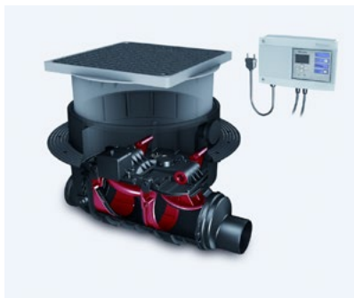
Automatyczny zawór zwrotny Staufix FKA Komfort